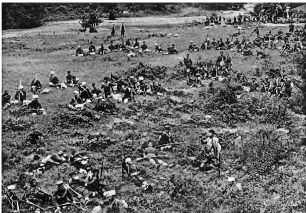
Четата на Герджикова (Одринско).